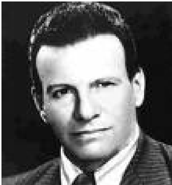
Самаэль Аун Веор